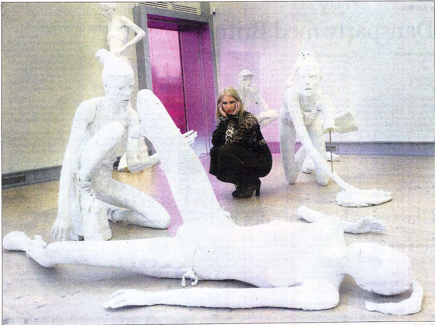
Med frigolit och ett tunt lager gips har konstnären Cajsa von Zeipel skapat stora skulpturer av lättklädda kvinnorn som visas under utställningen Ny scen/New Scene i Konsthallen på Bohusläns museum. Cajsa von Zeipel är uppvuxen i Ljungskile och verksam i Stockholm.