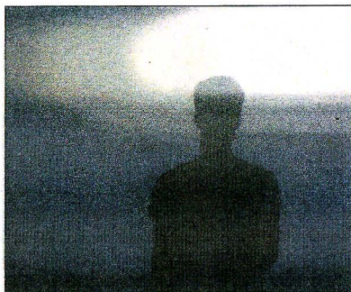
Voyage of perception/ wonder(vertigo) Olja på duk. Av Thomas Lundgren